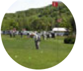
→ほくれい スカイロード