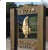
「子宝ウン精」 くるみなの庭