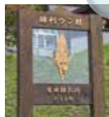
「勝利ウウン精」 当麻鐘乳洞

当麻町を歩いていると、所々で出逢う2頭の龍。これは「蟠龍伝説」をモチーフにしたもの。雲の中から現れた2頭の夫婦龍を先人たちが自分たちの守り神にし、この地の発展を願ったといわれています。伝説では当麻鐘乳洞(蝦夷蟠龍洞)は、龍神が休む所と語られています。