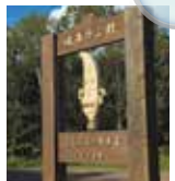
「健康ウン精」 くるみなの散歩道