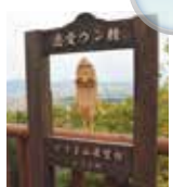
「恋愛ウン精」 とうま山展望台